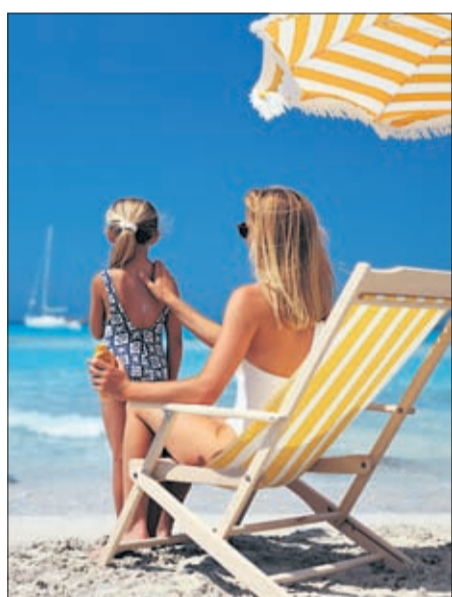
Zink ist vielseitig. Es kommt in der Nahrung vor, zum Beispiel in Austern, wird in der Architektur verwendet, im Autobau etwa bei Mittelkonsolen oder in der Kosmetik, beispielsweise in Sonnencremes.