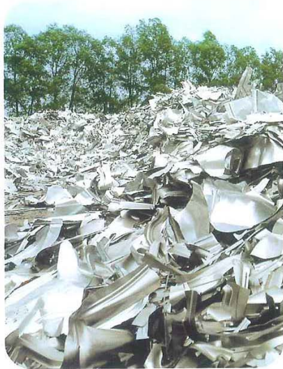
Verzinkter Stahlschrott wird für neue Produkte wiederverwendet.

Die ökologische Leistungsfähigkeit eines Materials wird im Allgemeinen über eine Lebenszyklusanalyse oder auch Ökobilanz ermittelt. In solch einer ökobilanziellen Betrachtung hat das Umweltbundesamt Deutschland für verschiedene Baumetalle die relevanten Wirkkategorien zusammengestellt. Im Rahmen dieser Studie fällt Zink in allen Kategorien durch günstige Werte auf.