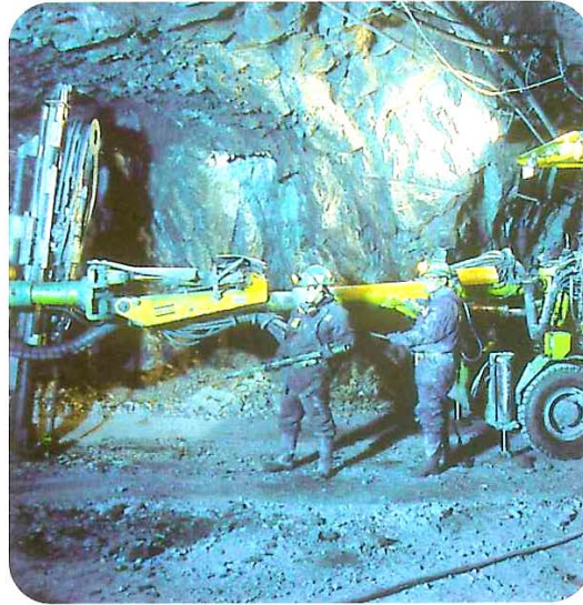
Unter schwierigsten Bedingungen wird Zink in Peru abgebaut.

„Die Initiative Zink ist ein Zusammenschluss von Zinkerzeugern, Zinkrecyclern, Halbzeugproduzenten, Herstellern und Verarbeitern von Zinkverbindungen unter dem Dach der Wirtschaftsvereinigung Metalle. Sie ist Ansprechpartner für Behörden, Anwender und für die Presse in allen Fragen rund um das Zink. Die Initiative Zink hat ihren Sitz in Düsseldorf und arbeitet in enger Kooperation mit nationalen und internationalen Zinkverbänden.“