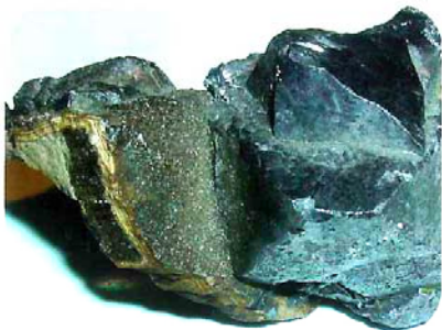
Bleiglanz (Galenit) mit Zinkblende.

Neben seiner Funktionalität überzeugt auch die große gestalterische Freiheit , die der Baustoff Zink ermöglicht.