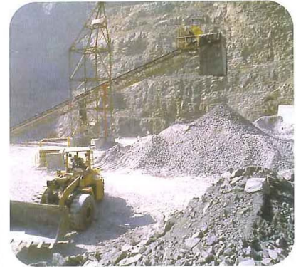
Die größten Fördermengen an Zink stammen heute aus China, Australien und Peru.

Römer aus einer Kupfer- und Zinkmischung Münzen erschmolzen, wird Zink als Rohstoff verwendet. Im 18. Jahrhundert begann die Förderung im größeren Umfang, die erste Zinkhütte entstand 1743 in Großbritannien. ➔