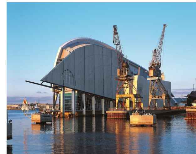
Maritime Museum Perth, Australien